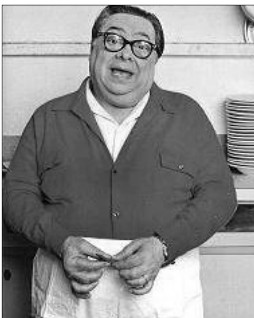
L'indimenticabile Aldo Fabrizi ai fornelli

So' du' vizietti, me diceva nonno, che mai nessuno te li pò levà, perché so' necessari pe' campà sin dar momento che venimo ar nonno.