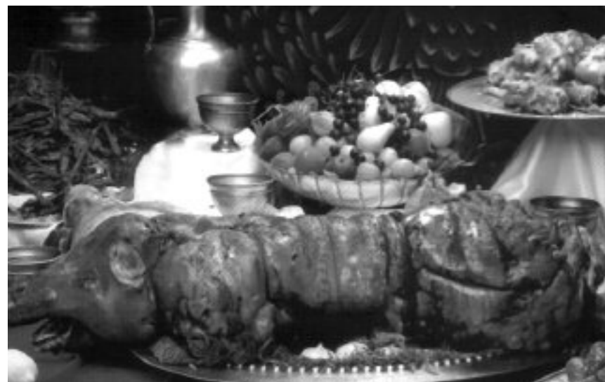
La porchetta tipico e rinomato prodotto dei Castelli Romani

L a cucina locale dei Castelli Romani ha una caratteristica inconfondibile: l'estrazione popolare. Più che altrove a Roma e quindi nel Lazio, come si è già accennato in relazione al vino, la cucina è cucina di osterie, di ricette preparate con cibi poveri, ma incline alla grande scorpiacciata. I sapori di queste terre in genere provengono dalle campagne influenzati dai prodotti di Roma che malgrado abbia alle spalle secoli di tradizioni aristocratiche legate al mondo prelatizio, non ha mai vantato ricette che uscivano dai "palazzi". Infatti la gastronomia della capitale nasce dal connubio della cucina ebraica, raffinata, ingegnosa e colta e da quella nata intorno ai mattoai che hanno come protagonista il "quinto quarto della bestia da macello" (frattaglie, zampe, code, guance e altri scarti).