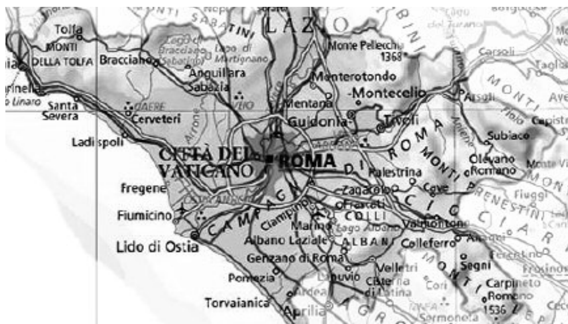
Il territorio rientrante nella Provincia di Roma

Nella zona a sud, nei Castelli e nei Prenestini notevole è la produzione delle castagne (rinomati i