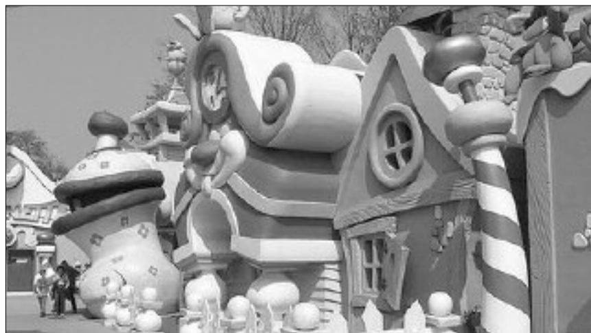
Parco Giochi a Valmontone: secondo Carella i "posti fissi" sarebbero solo 60, gli altri stagionali...

Uscirà qualche bando, qualche manifesto, qualcosa che annunci posti di lavoro nei centri per l'impiego dove ai cittadini e ai giovani venga data la possibilità di fare domanda e di partecipare a delle selezioni obiettive e non strumentalizzate dalle imminenti cam-