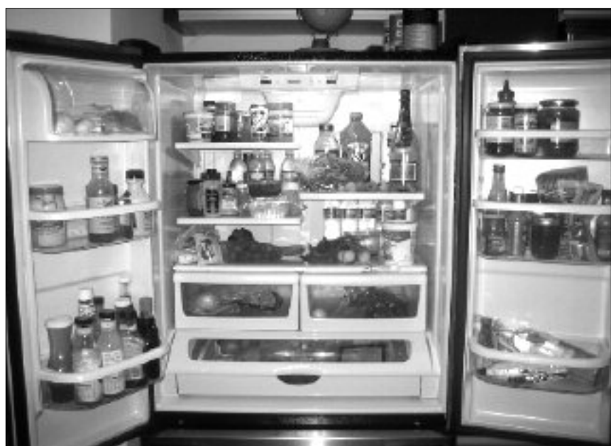
Frigoriferi pieni e rapporti "distorti" con il cibo

Per loro il disturbo alimentare si esprime come bulimia nervosa, o come "bigorexia", una patologia che porta a voler aumentare a tutti i costi la propria massa