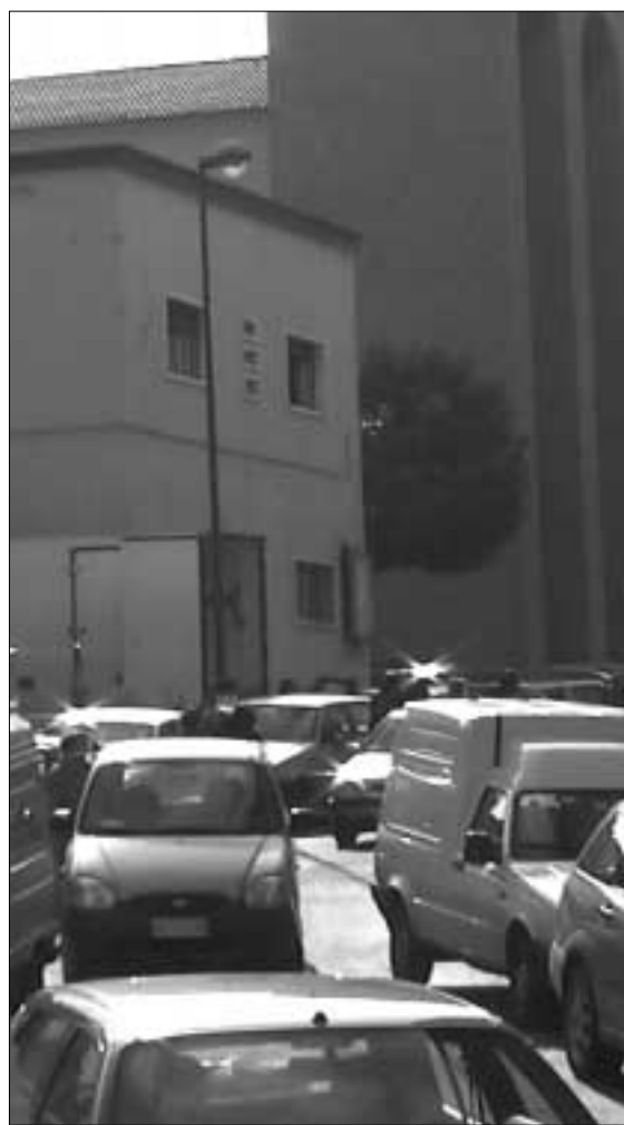
Via Sobrero: la selva di automobili attraverso la quale dovrebbero passare i Vigili del Fuoco in caso di chiamata urgente...