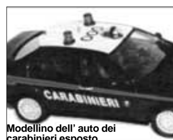
Modellino dell'auto dei carabinieri esposto