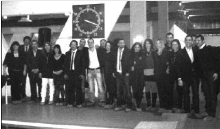
Lo staff al completo della piscina comunale

Tra i numerosi ospiti c'era infatti anche lo stesso Dell'Uomo, che viene spesso e volentieri in visita alla struttura in occasione di manifestazioni dedicate al suo sport