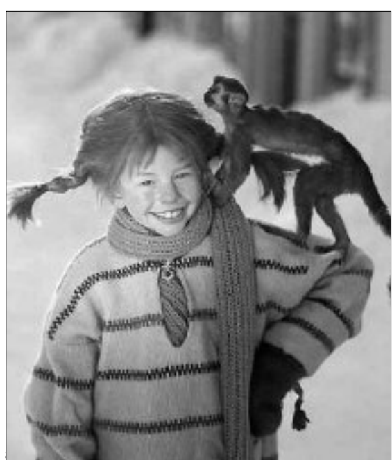
Pippi Calzelunghe e la sua inseparabile scimmietta

Si terrà la lettura-spettacolo "Pippi, sei una sago-