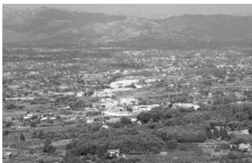
La Valle del Sacco, territorio dalle grandissime potenzialità di sviluppo economico