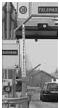
Un casello dell'A1

FERENTINO - Il futuro casello autostradale di Ferentino dopo anni di attesa, osservazioni e dibattiti, disappunti ed ipotesi, sta per diventare finalmente realtà.