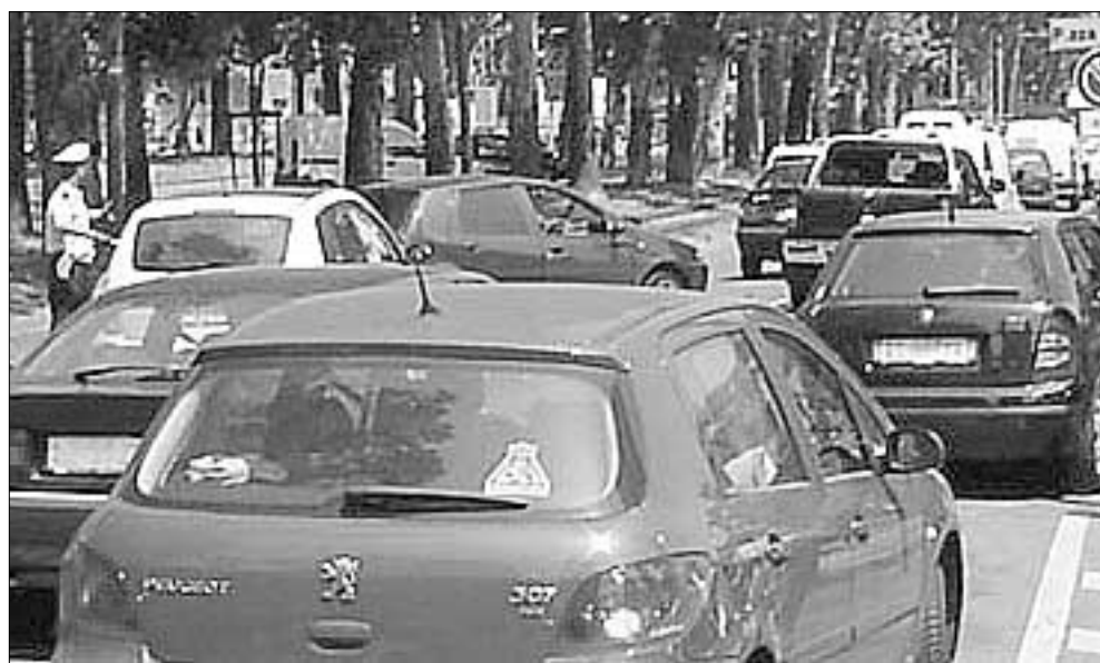
Traffico e smog nelle grandi città, un binomio inscindibile.