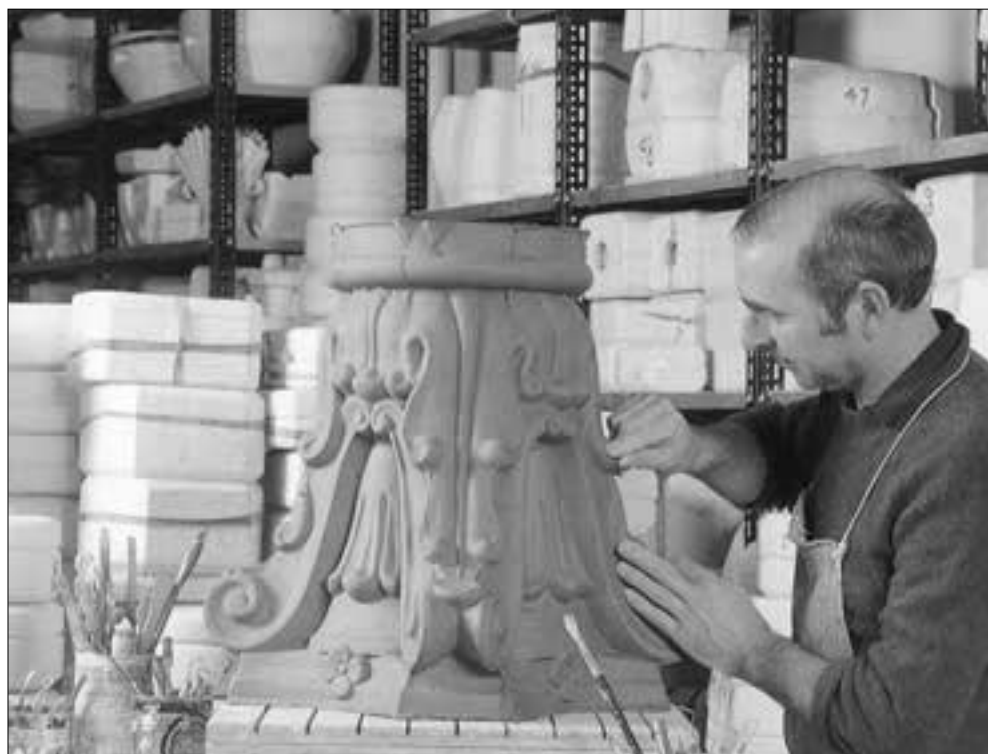
Un abile artigiano del settore della ceramica