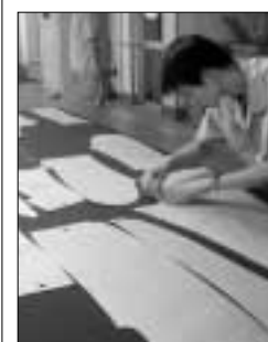
Un laboratorio cinese