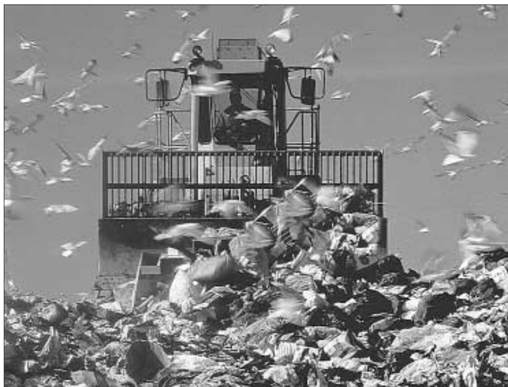
Attualmente nel Lazio i rifiuti ammontano a tre milioni e centomila tonnellate l'anno!