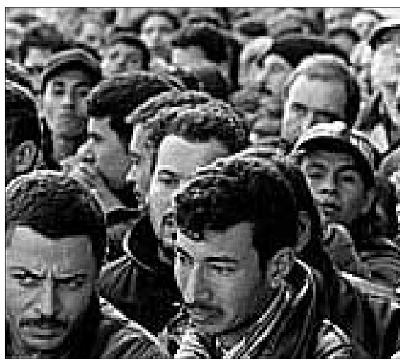
Immigrati fanno la fila davanti alle poste

La vecchia Europa che ha timore di crescere e non fa figli, dimenticando che l'involuzione la condanna all'impo-