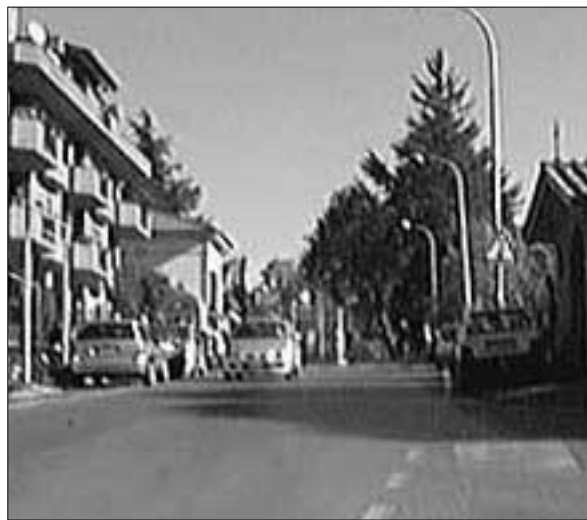
I roccapiorensi nutrono una grande devozione per S. Antonio Abate

quale era riprodotto il centro storico realizzato con la pasta del pane, quello riprodotto la Cappella rurale del Santo, e molti altri.