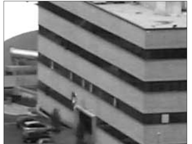
La sede del Gaia sulla Carpinetana a Collevero

COLLEFERRO / Dopo la recente distribuzione degli incarichi ai qualificati membri del CdA del consorzio