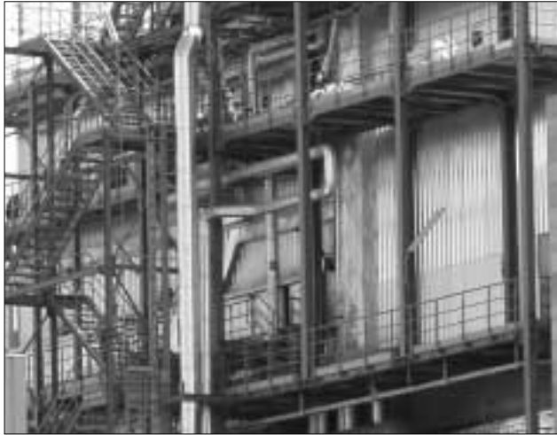
Il termovalorizzatore a Collevero Scalo