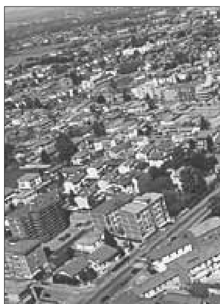
La Regione Lazio a favore dell'emergenza abitativa

ROMA - Un pacchetto casa da 317.525.000 euro è il fondo stanziato dalla Regione Lazio per dare una risposta concreta all'emergenza abitativa.