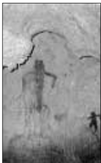
La grotta di Piglio

Eccezionale scoperta archeologica a Piglio