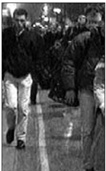
Pendolari in stazione

Ancora troppi disagi sulla linea della Roma-Cassino