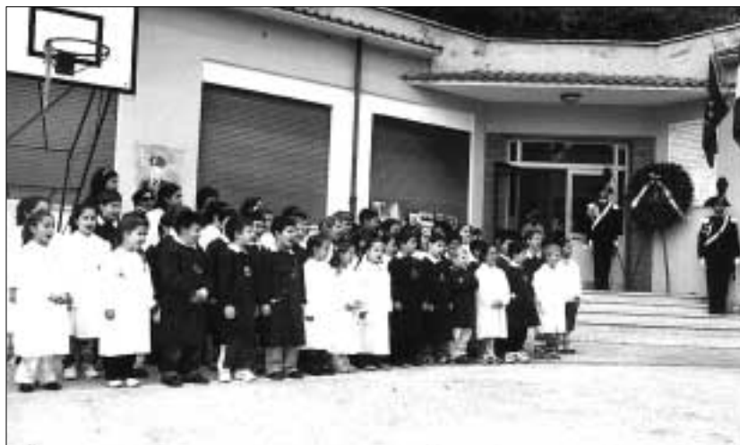
I piccoli alunni della scuola "Salvo D'Acquisto" di Macere