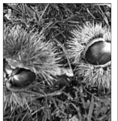
VICE Marroni segnini

rappresentazioni teatrali quali "Fatti di briganti" a cura dell'associazione La Miangola, da mostre micologiche, dalla corsa dei cavalli all'anello. Numerosissimi i gruppi musicali che hanno allietato la festa: Quelli che il canto.. J'Arlero, La runcio's Band, Jo Concono, Popolaria. Suggestivi, come sempre, l'apertura della porta Gemina e il corteo storico della copeta nonchè il concerto di benvenuto della Banda Musicale Città di Segni. La sagra del marrone, con il suo calendario ricco e vario di manifestazioni si configura sempre più come uno degli eventi più importanti della comunità cittadina richiamando numerosissimi visitatori; come appendice alla sagra, nelle giornate del 5 e 6 novembre presso la sala polifunzionale di via Traiana si terrà il Marrone d'oro concorso gastronomico nazionale.