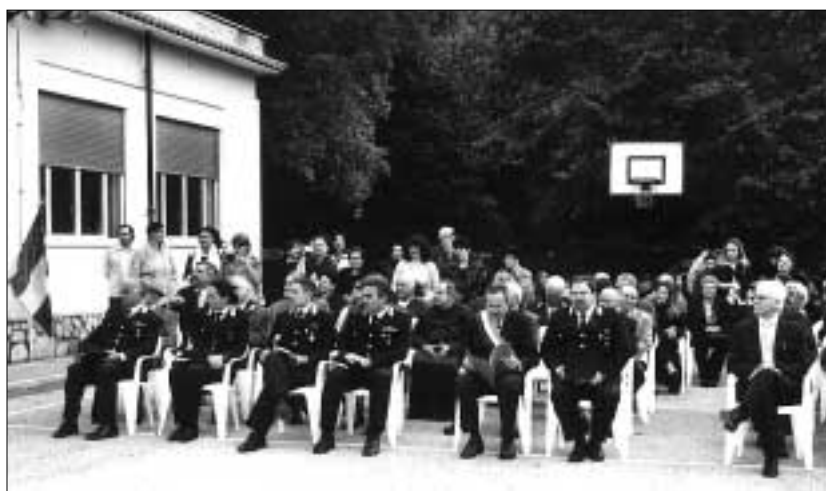
Le autorità locali presenti alla manifestazione