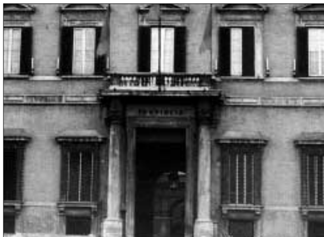
Palazzo Valentini, sede dell'amministrazione provinciale di Roma