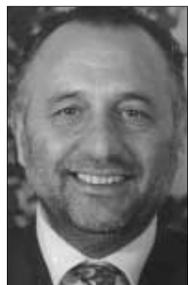
L'On. Mario Cacciotti

ROMA (Agestampacas) - Questo mercoledì 14 maggio a Palazzo Valentini, sede della Provincia di Roma, viene presentato un progetto-pilota di straordinaria innovatività relativo alla formazione degli istruttori delle autoscuole. Il sistema è basato sulla comunicazione visiva e consentirà alle persone sorde di poter frequentare le lezioni teorico-pratiche di scuola guida.