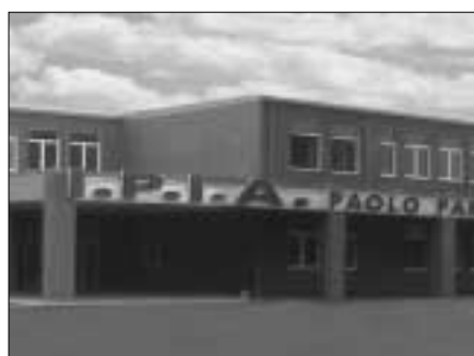
L'ingresso dell'Ipia "Paolo Parodi Delfino"

matica multimediali di cui uno dedicato a materie specifiche d'indirizzo (sistemi) e l'altro alle materie curriculari quali lettere, matematica, fisica e inglese. Rispetto al progetto di partenza la scuola aveva inoltrato la richiesta - subito accettata dalla Provincia e puntualmente realizzata dalla ditta incaricata - di un ampliamento dei labo-