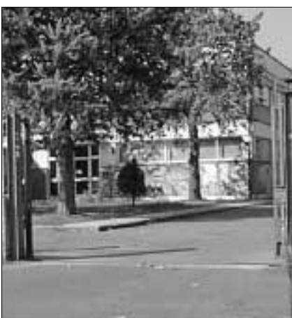
L'ingresso del Liceo Scientifico Marconi