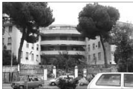
L'ospedale di Colleferro