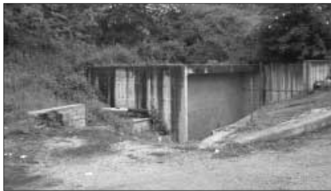
La Sorgente Merago

L'intervento si concluderà con il collettamento delle vene verso il fosso delle Pantana. L'obbiettivo