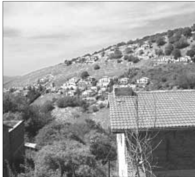
Il comprensorio del Monte Scalambra

Il costo del progetto NATURISMO, articolato nelle sue due fasi, prima e seconda, è di Euro 28.146.901,00, che in lire fanno 54.500.000.000. Per il solo risa-