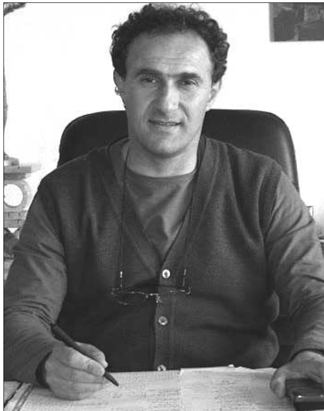
Il sindaco Tommaso Damizia