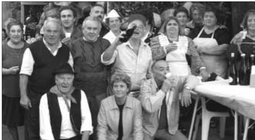
Il Centro Anziani di Serrone alla manifestazione "Il Nonno Insegna"

Nella relazione semestrale sono state evidenziate altre importanti attività, quali quella