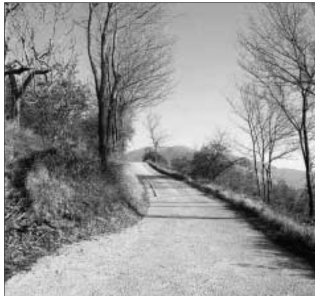
Strada oggetto di intervento della XII Comunità Montana

UN'ALTRA buona notizia, che va ad aggiungersi a quelle indicate in questa pagina, riguarda la sistemazione di via San Giovanni, di quella strada cioè che da Serrone porta a Piglio, contrada Romagnano.