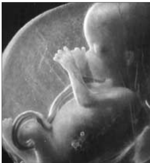
DEL SOLE a pagina 8