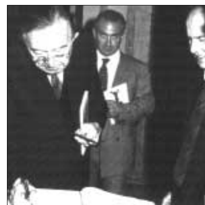
Il sen. Andreotti a Segni